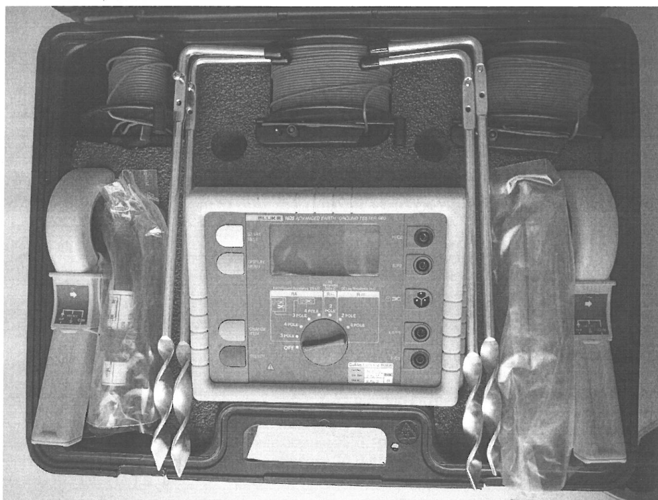
Рисунок 3 - Тестер Fluke 1625 с полным комплектом принадлежностей.

На передней панели тестеров расположены: жидкокристаллический дисплей, переключатель режимов измерений, клавиши управления, а также разъемы для подключения измерительных проводов и измерительных клещей. Пломбирование корпуса тестеров от несанкционированного доступа не предусмотрено.