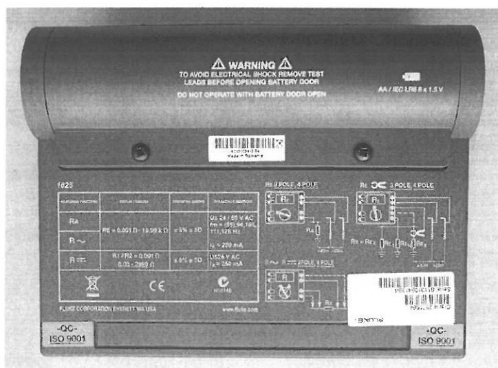
Рисунок 2 - Внешний вид тестера заземления Fluke 1625, вид снизу.